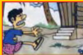
Cirit-birit yang berlarutan