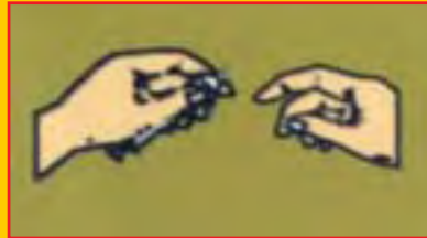
Berkongsi jarum suntikan

Seperti pembawa HIV yang lain, penagih dadah yang dijangkiti HIV boleh memindahkan virus ini melalui 3 cara utama: