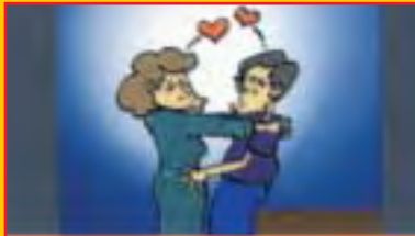
Hubungan seks berlainan jantina atau sejenis