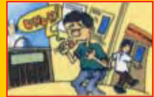
Batuk yang berterusan

Beberapa tahun selepas dijangkiti, pembawa HIV mungkin mengalami beberapa masalah kesihatan seperti berikut :