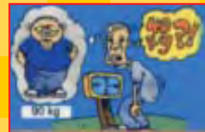
Susut berat badan